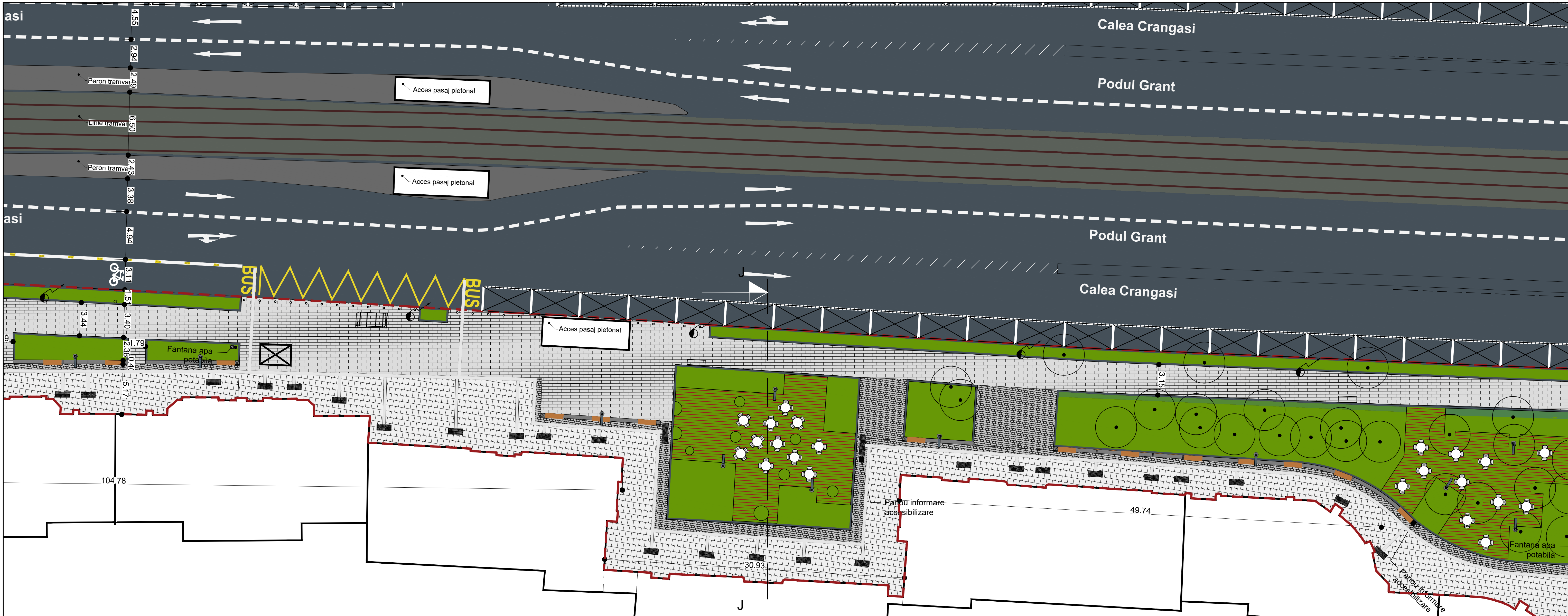
PLAN DE SITUATIE 1:200